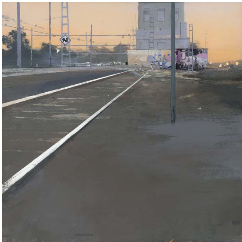
Graffiti 25 x 25 cm. Mixta sobre tabla