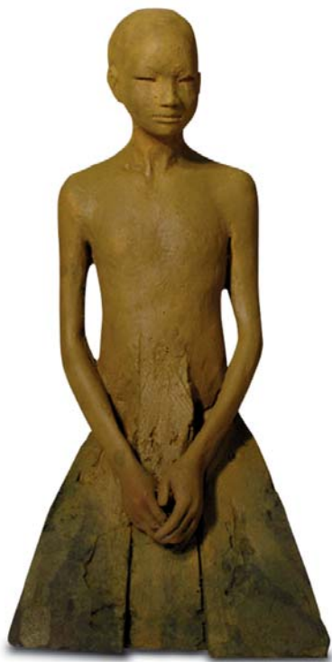
Rodillas 15 x 11.5 x 29 cm. Bronze