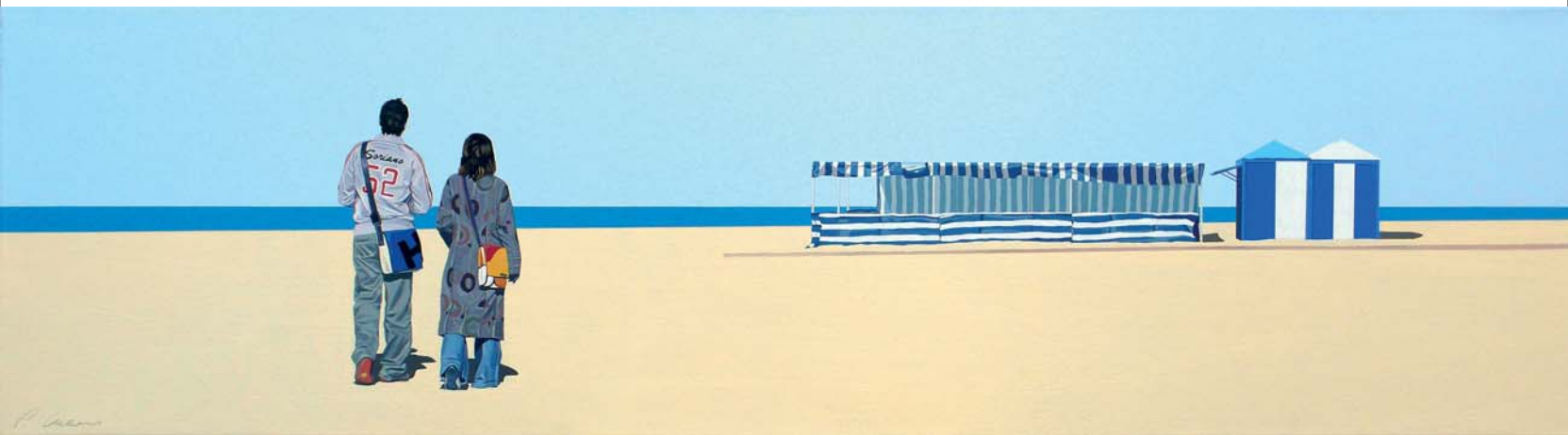
Paseo de invierno por la Playa 30 x 110 cm. Acrílico sobre lienzo