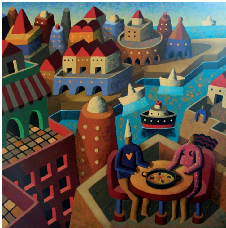
Gastronomía típica de una tarde de verano 60 x 60 cm. Mixta sobre lienzo