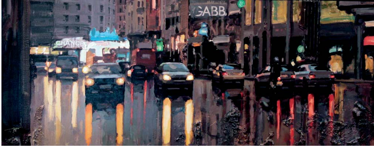
Madrid Nocturno 28 x 70 cm. Mixta y collage sobre tabla