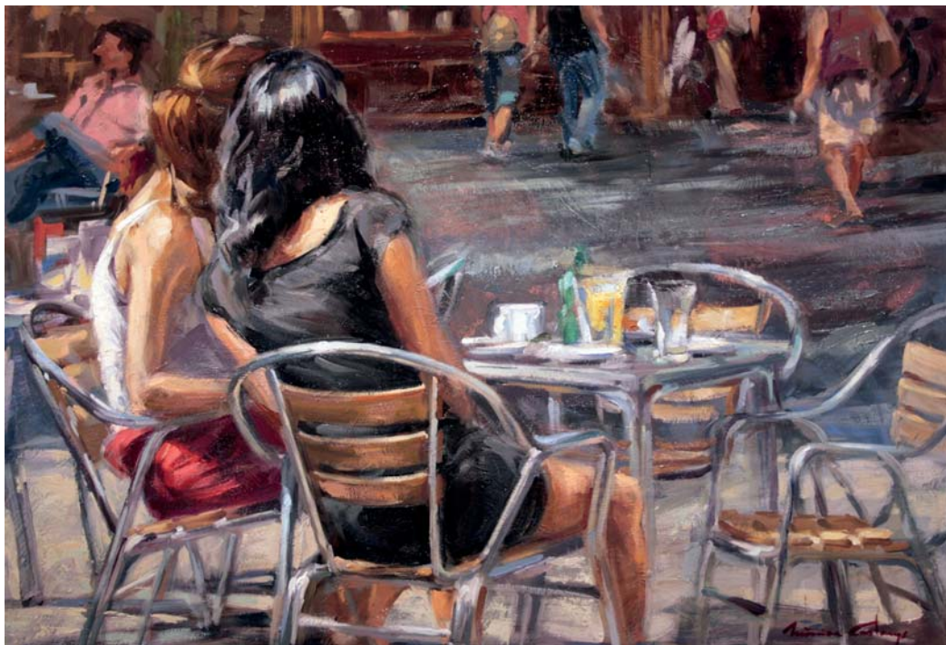
Confidências 50 x 73 cm. Óleo sobre tabla