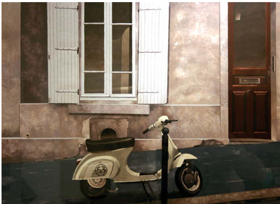
La 53 56 x 76 cm. Acuarela